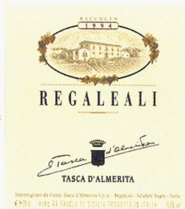
Regaleali Rosso varunummer 22303