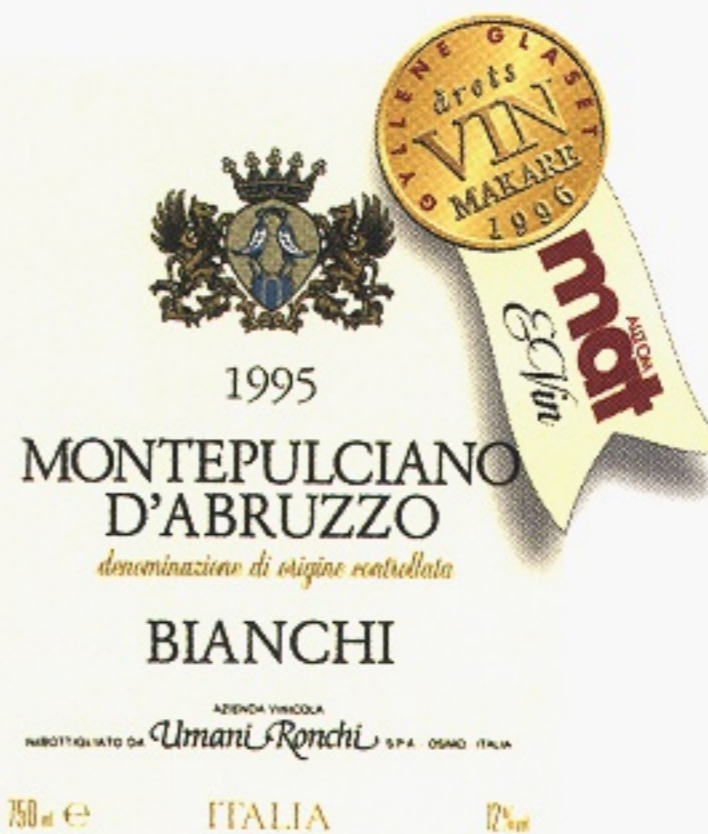
Montepulciano d'Abruzzo Bianchi varunummer 7126