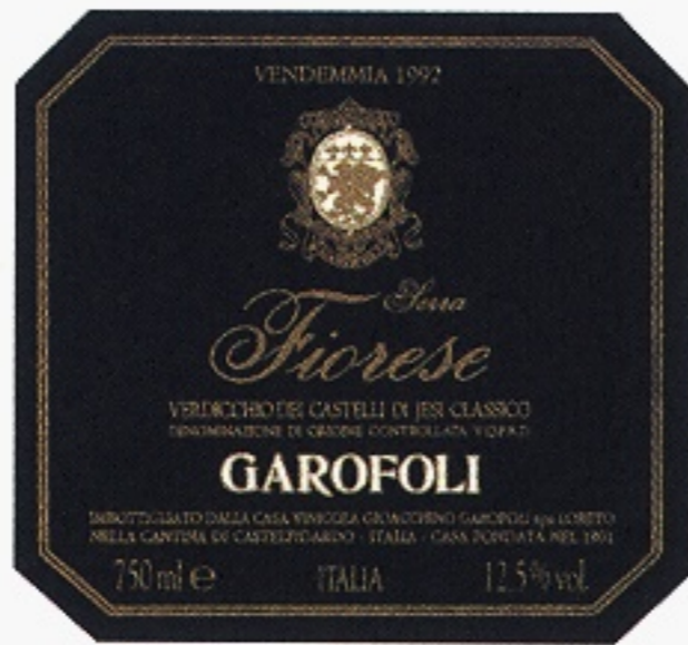
Serra Fiorese varunummer 2441