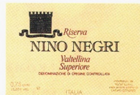
Valtellina Superiore Riserva varunummer 12351