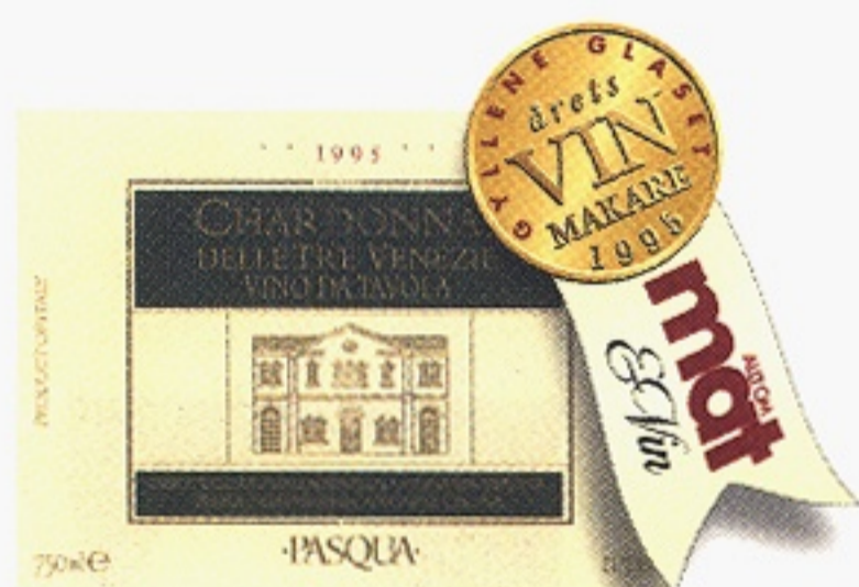
Pasqua Chardonnay delle Tre Venezie varunummer 2907