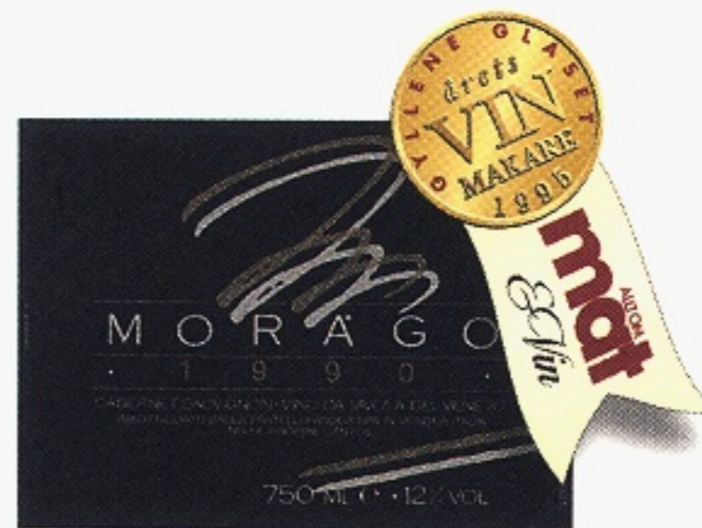
Morago Cabernet Sauvignon varunummer 12350