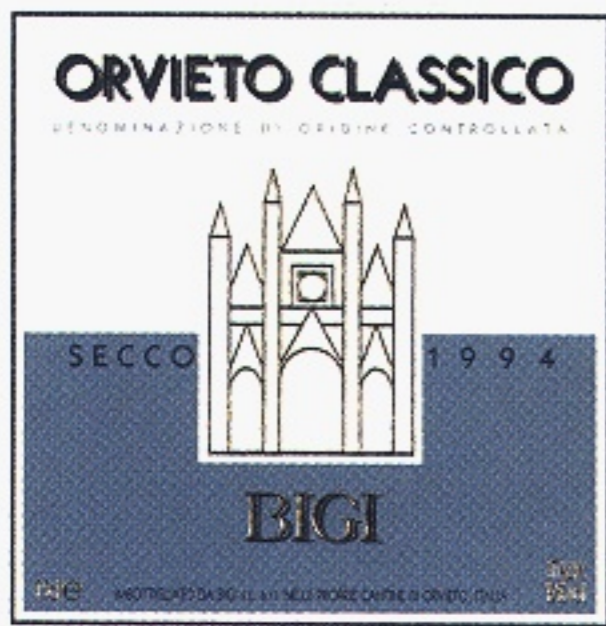
Orvieto Secco varunummer 2403