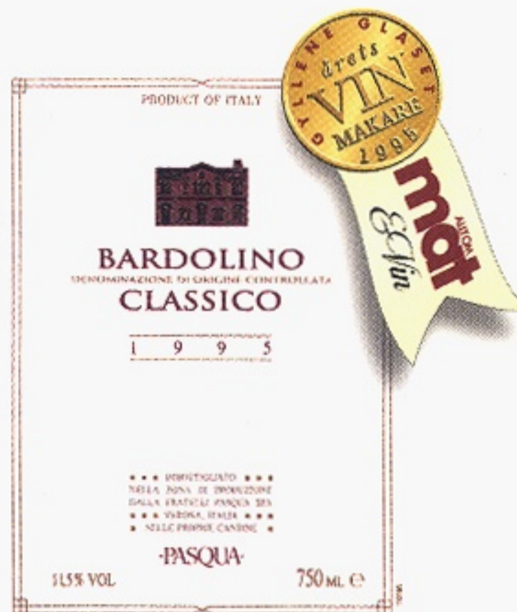
Pasqua Bardolino Classico varunummer 2329