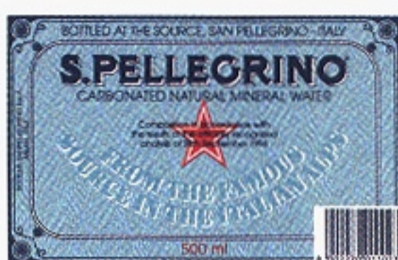
Sanpellegrino Natural Mineral Water varunummer 1943