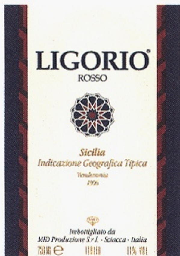
Ligorio Rosso varunummer 2354