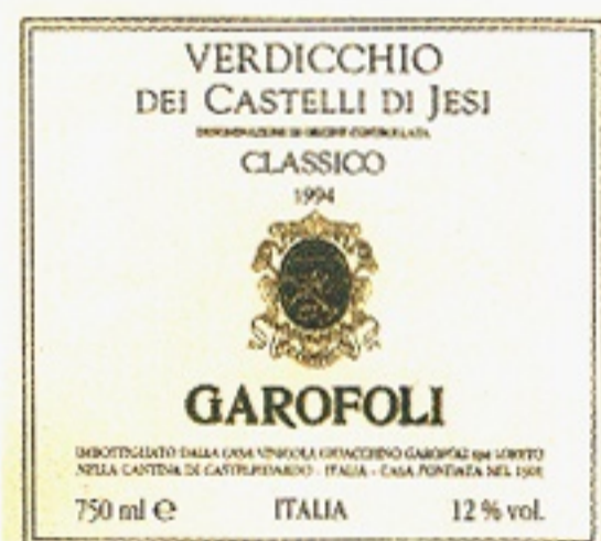
Verdicchio dei Castelli di Jesi varunummer 2409