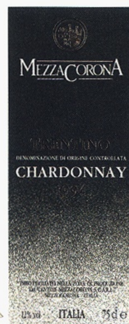
Trentino Chardonnay varunummer 2407