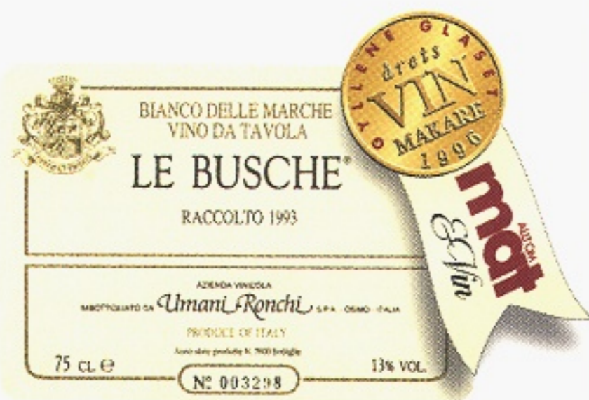
Le Busche varunummer 2598