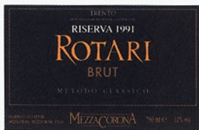
Rotari Brut Riserva varunummer 7567