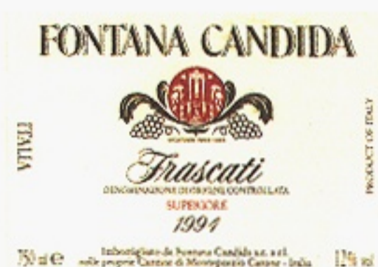
Frascati Superiore varunummer 2410