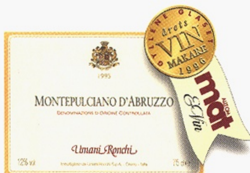
Montepulciano d'Abruzzo varunummer 2337