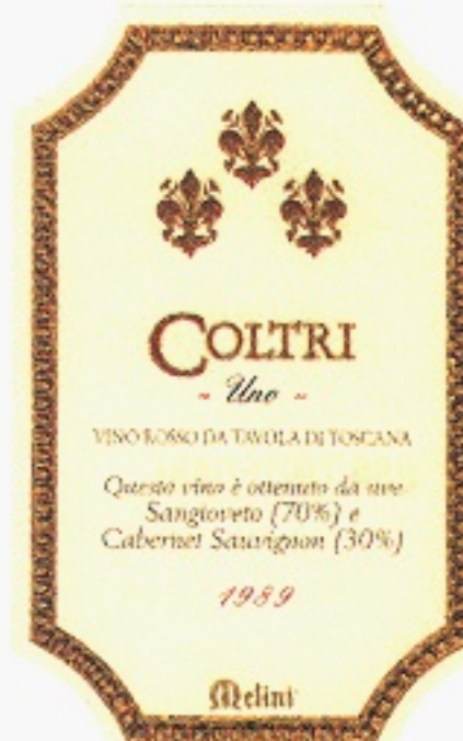
Coltri Uno varunummer 12353

har vi alltid tillgång till våra producenters mer speciella viner. Ofta i små kvantiteter. Vi har därför stora möjligheter att hjälpa den restauratör som söker "sitt" vin.