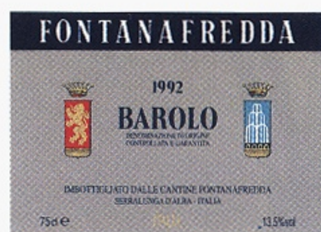
Barolo, Fontanafredda varunummer 2305