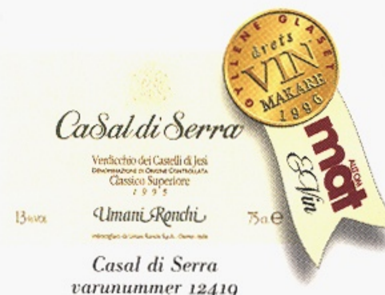
Casal di Serra varunummer 12419