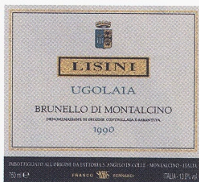
Lisini Brunello di Montalcino "Ugolaia" varunummer 82094 (best. sortiment)