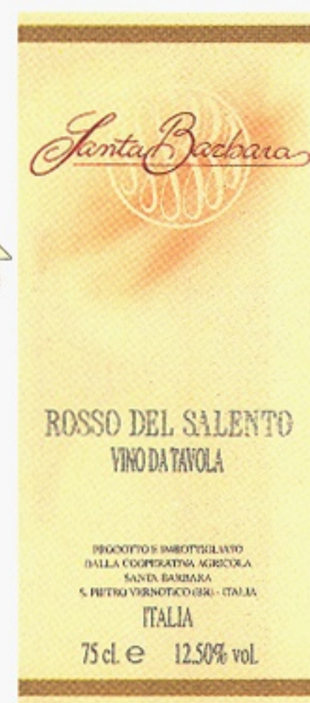
Rosso del Salento varunummer 12305