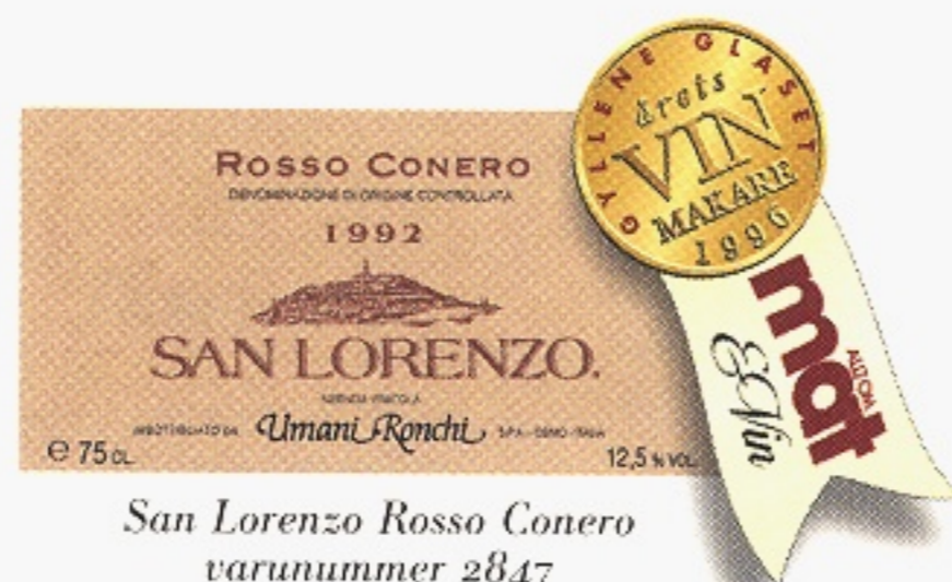
San Lorenzo Rosso Conero varunummer 2847